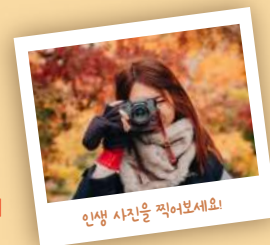
인생 사진을 찍어보세요!