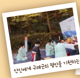
산신에게 구례군의 평안을 기원하는